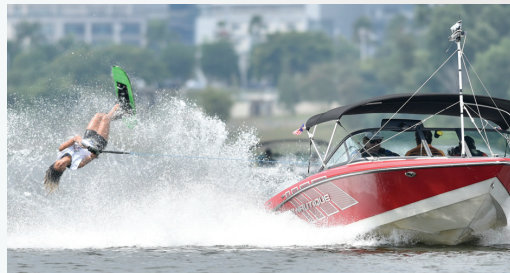
Foto 2 Permainan ski air