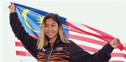
Foto 3 Pemenang pingat emas acara ski air Sukan SEA 2017